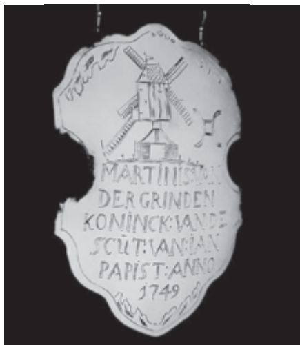
De oudst bekende afbeelding van een standermolen in relatie tot Soerendonck is het koningsschild van molenaar Martinus van der Grinten. Opschrift: MARTINUS VAN DER GRINDEN: KONINCK VAN DE SCUT VAN IAN PAPIST: ANNO 1749. Afbeelding van een standaardmolen, waarnaast een molenijzer (collectie Sint-Jansgilde, Soerendonck).

voortaan geene graanen van wat soort het mogten sijn, meer te voeren of vervoeren na molens buiten s Lands gelegen, om aldaar gebroken of gemalen te worden, of buiten s Lands gebroken of gemalen zijnde, in de voorszegde dorpen in te brengen” of anders een boete riskeerden van 100 gulden per overtreding (4).