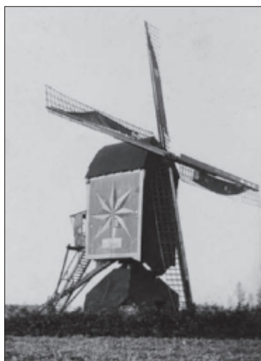
Deze foto van de molen te Soerendonk in de Zitterd geeft een goed beeld van de voorzijde van de molen met het wienkruis, ca. 1930.

Aan het einde van dit artikel hebben wij een lijst opgenomen van de tot nu toe, sinds 1590 bekende molenaars van de molen te Soerendonk (9).