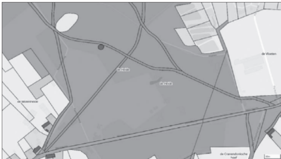
De ligging van de molen aan de Molenheide op de oudste kadasterkaart van 1832. Als ondergrond is de huidige situatie weergegeven (werkgroep kadaster, Heemkundekring ‘De Baronie van Cranendonck’, Budel).