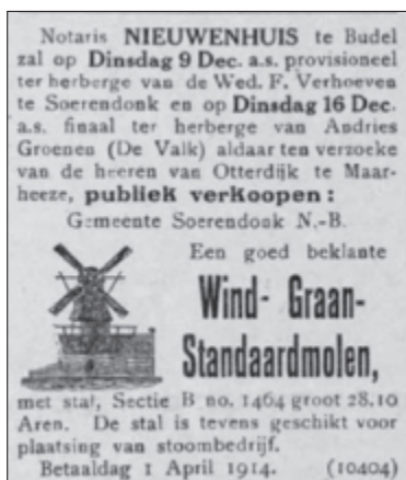
Advertentie van de openbare verkoop van de molen in 1913 in 'De Molenaar' van 26 november 1913.

Aan het einde van dit artikel hebben wij een lijst opgenomen van de tot nu toe, sinds 1590 bekende molenaars van de molen te Soerendonk (9).