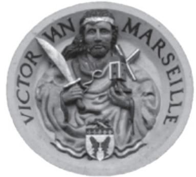
Afbeelding van Sint Victor in molen Nooit Gedagt te Woudrichem.

De legende wil, dat er bij de terechtstelling een groot wonder geschiedde: het lichaam van Sint Victor doet de molenstenen breken. Uiteindelijk zou hij zijn onthoofd. Zijn relikwieën zijn overgebracht naar de abdij Saint-Victor in Marseille. Tegenwoordig worden ze bewaard in de Église Saint-Nicolas-du-Chardonnet. Veel molens dragen de naam 'Sint Victor', bijvoorbeeld de molen van Heeze.